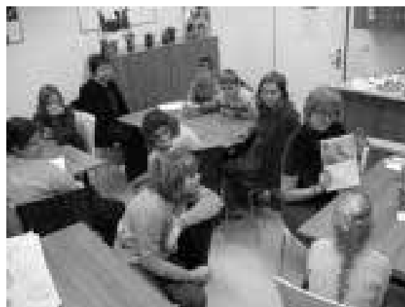
Olympiáda v angličtině

11/55. Týmy Lišáků (6. třída), Modráků (6. třída), Velbloudů (7. třída) a Tučňáků (8. třída) se utkaly celkem v pěti disciplínách, které prověřily nejen jejich znalosti z práva, ale také schopnost vyjádřit svůj názor, být pohotový a spolupracovat v týmu. Mezi jednotlivými disciplínami diváky pobavila dvě taneční vystoupení i rozhovory se zajímavými lidmi naší obce. Vítězství nakonec připadlo velmi těsně družstvu ze 7. třídy, kterému dýchalo na záda družstvo z 8. třídy. Toto družstvo mělo mohutnou podporu fanoušků ze třídy, kompletně oblečených v barvách týmu, kteří přispěli velkou měrou k výborné